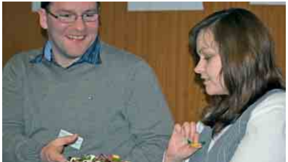
Süßes zwischendurch kann den Stress reduzieren. Aber eine gesunde, ausgewogene Ernährung und ausreichend Zeit beim Essen sind wichtig.