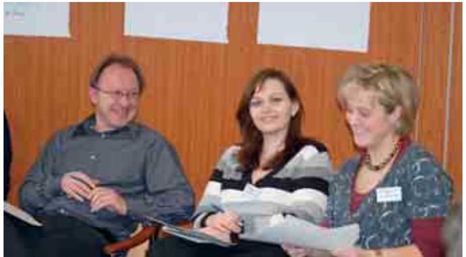
Lachen gegen den Stress: Unserem Gehirn ist es egal, ob wir aus Freude oder grundlos lächeln. Die beteiligten Muskeln signalisieren den grauen Zellen so oder so, dass gelächelt wird, woraufhin diese Glückhormone freisetzen. Diese heben die Laune, wirken entzündungshemmend und verbessern die Wahrnehmung.