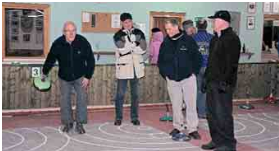
Konzentriert war jede Mannschaft bei der Sache.

berg, gefolgt von den „Daubntratzern“ der HS Osterhofen und der „M10“ aus Plattling. Alle Beteiligten genossen es sichtlich, einmal außerhalb des Schulbetriebes - sozusagen zur Halbzeit des Schuljahres – ein entspanntes Miteinander zu pflegen und waren sich einig, dass dies nicht die letzte Meisterschaft im Stockschießen für Lehrermannschaften gewesen ist.