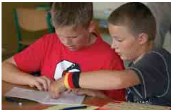
Schüler unterstützen und helfen sich im modularisierten Unterricht gegenseitig.

Handwerkslehre. In den letzten Jahren war es jedoch so, dass auch für einfache Handwerksberufe lieber Realschüler, teils sogar Gymnasiasten eingestellt wurden. Immer deutlicher wurde in den vergangenen Jahren, dass viele Schüler die Hauptschule ohne entsprechende Basiskenntnisse verlassen. Arbeitsämter und Vertreter der Wirtschaft und des Handwerks bemängeln dies bereits seit vielen Jahren. Durch die PISA-Tests wurden diese Erkenntnisse untermauert. Diese Hauptschüler haben kaum eine Chance auf dem Arbeitsmarkt. Um gegen dieses Negativ-Image der Hauptschule anzukämpfen, dass sie nur aus „Übriggebliebenen“ bestehe, hat die bayerische Staatsregierung die Hauptschulinitiative ins Leben gerufen. Ein Teilbereich dieser Hauptschulinitiative ist die Modularisierung. Lerninhalte werden dabei in einzelne Bausteine aufgeteilt. Ziel ist es, dass jeder Schüler Kernkompetenzen vermittelt bekommt. Die Modularisierung des Unterrichts gibt den Schülern somit die Chance zumindest die Grundkompetenzen in den Fächern zu erwerben. Durch positive Lernerfahrungen und jahrgangsübergreifende Differenzierung und Individualisierung werden Lernrückstände vermindert. Bei leistungsstärkeren Schülern soll durch eine veränderte Aufgabenkultur das mathematische Denkvermögen gefördert werden.