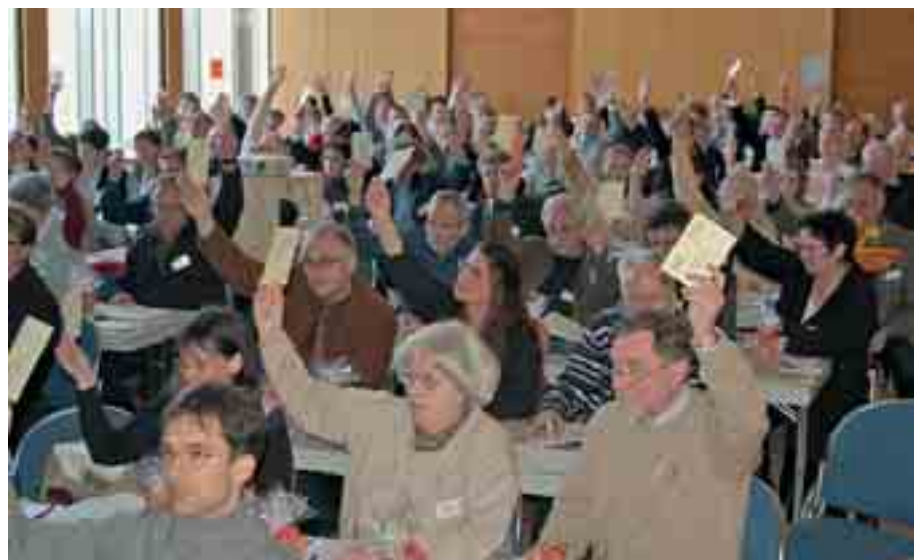
Die Delegierten des BLLV fordern eine regionale Schulentwicklung.

Der BLLV möge sich dafür einsetzen, dass die Festlegung des Notenschlüssels bei Abschlussprüfungen an der Realschule in allen Fächern vorab erfolgt.