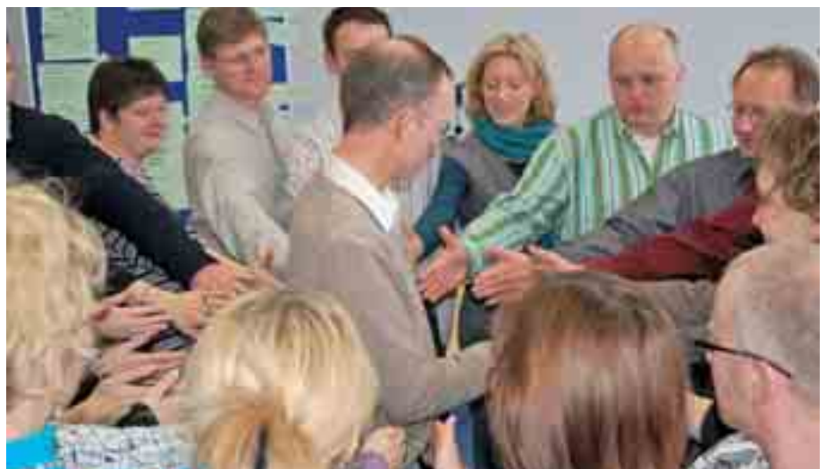
Probleme nicht alleine lösen. Die Gruppe oder das Lehrerkollegium ist ein großes Potenzial, dass gerade wir Pädagogen nutzen sollten. Die kollegiale Beratung kann ein hilfreiches Instrument sein, Stress zu vermeiden, so Veeseer.