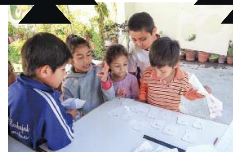
Rechenspiele: Die Kleinen lernen von den Großen

Im Kinderhaus helfe ich den Kindern hauptsächlich bei den Hausaufgaben, mache Lernspiele mit ihnen oder kleine Workshops. Wissbegierig und interessiert fordern sie ständig Hilfe bei ihren Aufgaben. Doch bei aller Freude und Motivation zeigt sich schnell, dass einige Grundlagen fehlen.