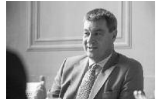
... dem bayerischen Finanzminister Markus Söder