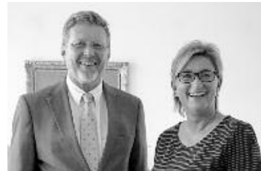
... Minister Marcel Huber, Leiter der Bayerischen Staatskanzlei