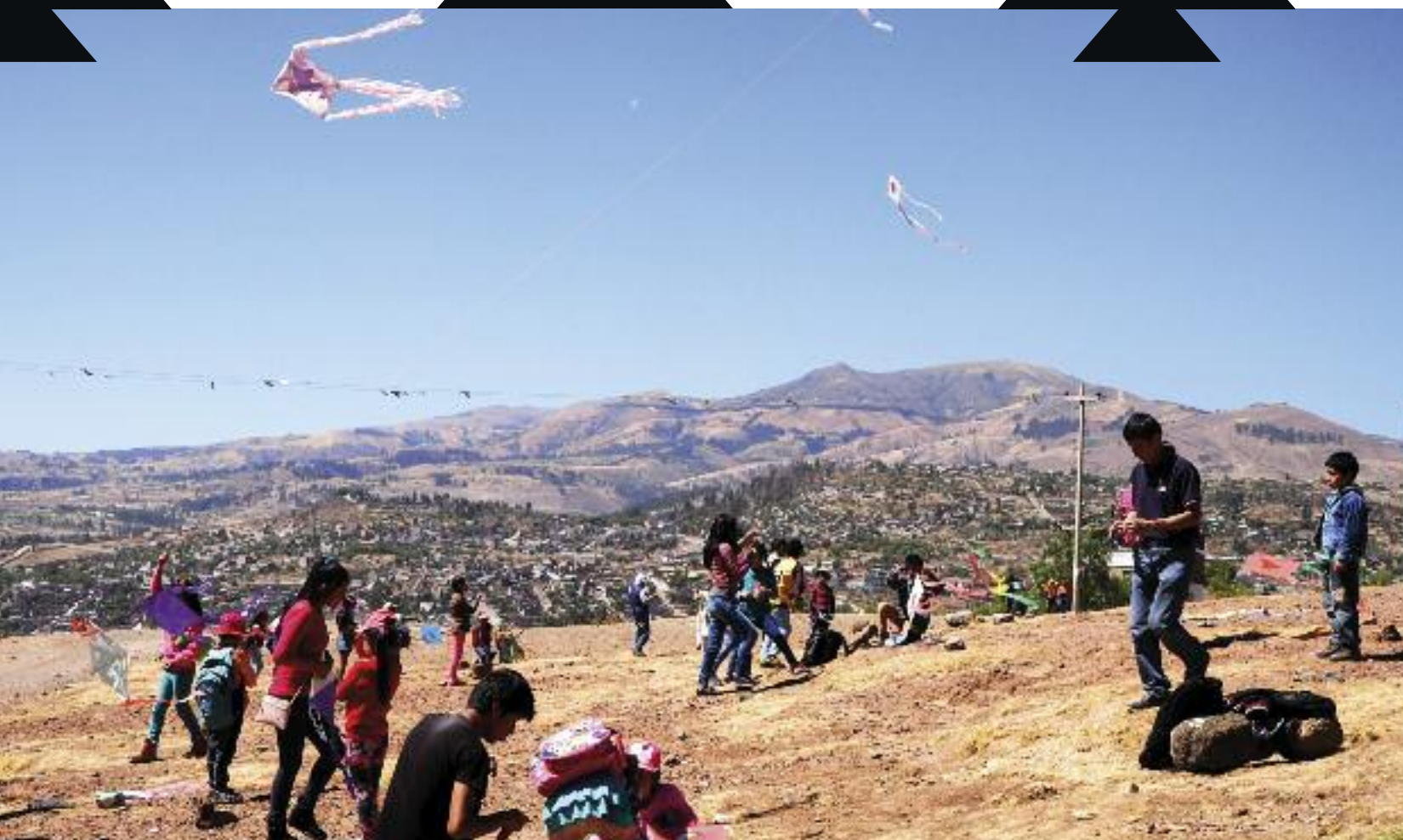
Drachenfest in den Bergen: Die Kinder und Jugendlichen sind stolz auf ihre selbstgebastelten Drachen aus Papier und Stroh