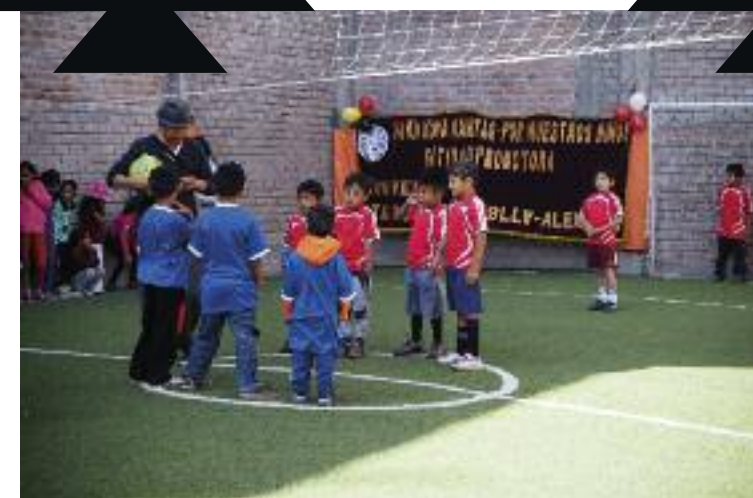
Hallenfußball: Generalprobe für ein Turnier in Ayacucho

Casadeni verfolgt einen systemischen Ansatz in der sozialpädagogischen Arbeit. Besonders wichtig ist die Elternarbeit. Daher wird jeden ersten Freitag im Monat ein Gespräch angeboten. Es geht um Kinderrechte, Erzie-