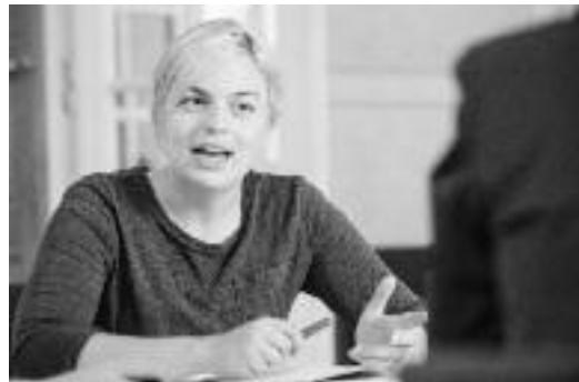
... der Fraktionsvorsitzenden der Grünen, Katharina Schulze