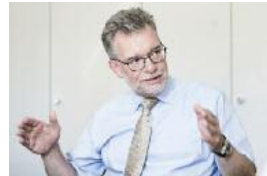
... dem Ministerialdirigenten Walter Gremm